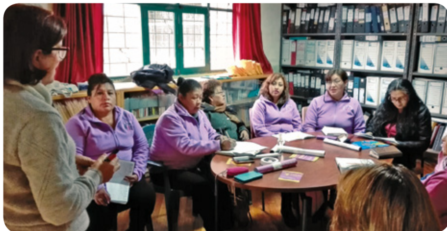
■ Taller-Capacitación sobre uso de material de comunicación dirigido a mujeres afectadas por violencia intrafamiliar y de género en la Fundación Casa de Refugio Matilde.

Los casos de violencia de género, especialmente los cometidos contra mujeres, niños, niñas y adolescentes pueden ser de diversos tipos: físicos, psicológicos, sexuales, patrimoniales, obstétricos y violencia política cuando se participa abiertamente en la política barrial, de la ciudad o del país.