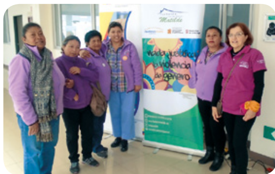
■ Colocación de placas informativas en el Hospital Gineco-Obstétrico de Nueva Aurora Luz Elena Arismendi.

Los casos de violencia de género, especialmente los cometidos contra mujeres, niños, niñas y adolescentes pueden ser de diversos tipos: físicos, psicológicos, sexuales, patrimoniales, obstétricos y violencia política cuando se participa abiertamente en la política barrial, de la ciudad o del país.