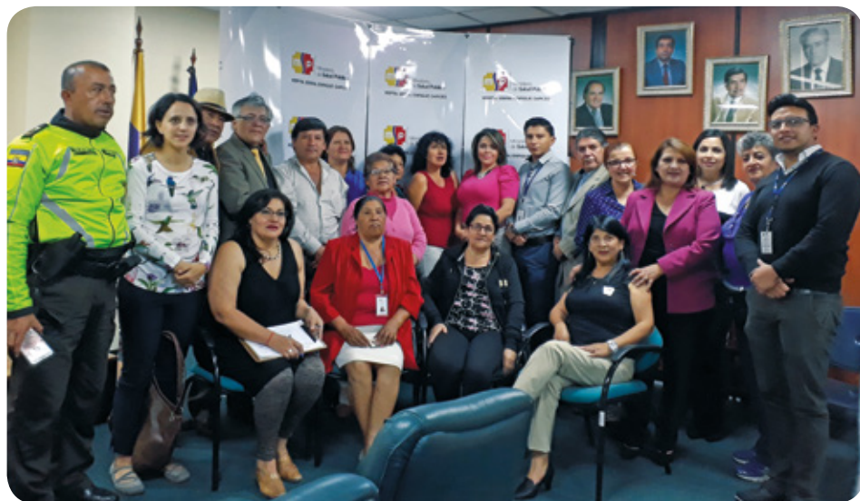
Participación en la reunión del Comité de Usuarios del Hospital General Enrique Garcés.