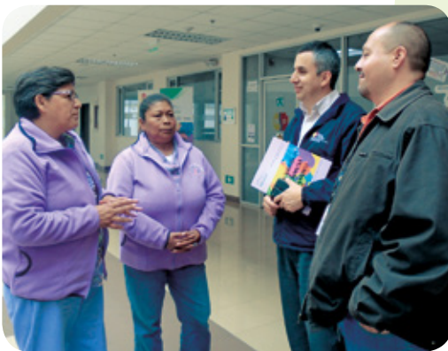
■ Participación en el evento por el Día Internacional de la Eliminación de la Violencia contra la mujer en el Hospital Gineco-Obstétrico de Nueva Aurora Luz Elena Arismendi. 25 de Noviembre de 2018.

“Cómo descubrir que ésta persona está viviendo violencia de género... yo creo que se le debe hacer, con todo respeto, la pregunta directamente: ¿está usted viviendo violencia? Tenemos que engancharla, motivarla y apoyarla para que siga buscando solución a su situación de violencia”. (Médica del MSP-2018).